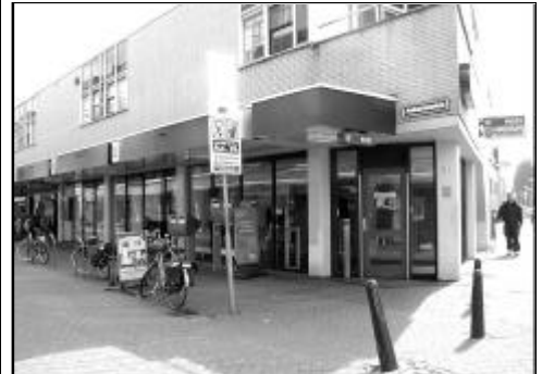
Postkantoor aan het Ambachtsplein 115.