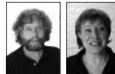
Professional Ben Secretariaat Nienke

Ambachtsplein 141 3068 GV Rotterdam ☎ 010 - 2892400 e-mail: Infozevenkamp@xs4all.nl website: www.bo7kamp.nl