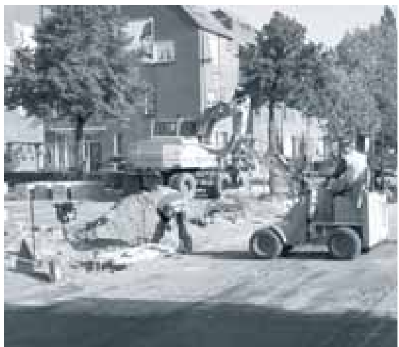
Aan de kruising Zevenkampse Ring / Tjonger wordt hard gewerkt.

Voor nadere informatie kunt u contact opnemen met de heer G.A. Wabbijn, ☎ 06 - 22930407.