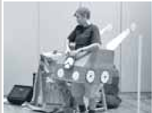
Pluk opweg naar de kluiselaar.