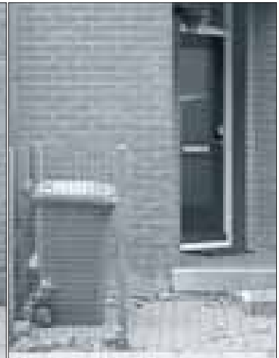
Netjes weer teruggezet.