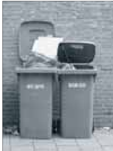
Zo moet het dus niet!

Als u het grofvuil niet zelf kunt wegbrengen, kunt u een afspraak met de Roteb maken, ook weer op het algemene eerder genoemde telefoonnummer. Overigens wordt bouw- en sloopafval niet los opgehaald. U kunt dit gratis wegbrengen naar een van de