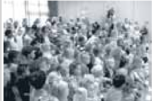
De kinderen kijken gespannen.

Zij hebben namelijk aan het begin van de dag een toneelstukje opgevoerd over Pluk van de Petteflet. Mede dankzij de hulp van een aantal ouders is het toneelstuk een succes geworden! Zij hebben namelijk onder andere het prachtige decor gemaakt en het kraanwagentje van Pluk. Ouders nogmaals BEDANKT! De kinderen (en de leerkrachten) hebben genoten