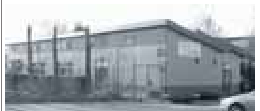
De Eekhof aan de Tochten.

Het adres van onze vereniging is: Bridgeclub "De Tochten" Verenigingsgebouw De Eekhof, Cole Porterstraat 2, 3069 ZD Rotterdam (Zevenkamp) ☎ (010) 4564 644.